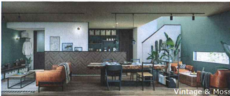
Vintage & Moss

さらにマイページをつくと、 家づくりの費用感もわかり、プロに相談することもできます。