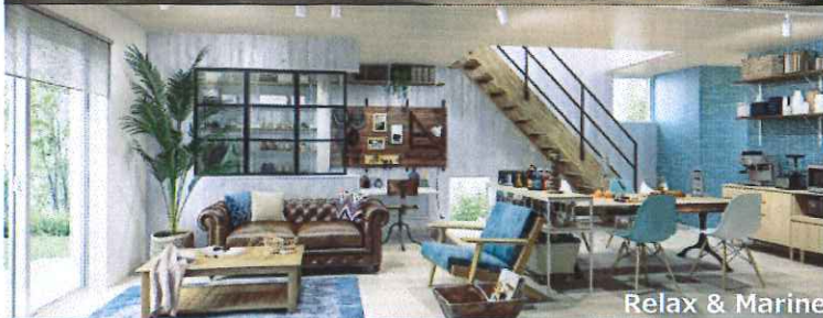
Relax & Marine