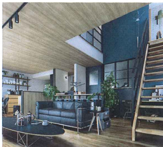
Nero & Rustic

あなたのライフスタイルにマッチする、本当に自分らしい家。 それが「Lifegenic (ライフジェニック)」です。